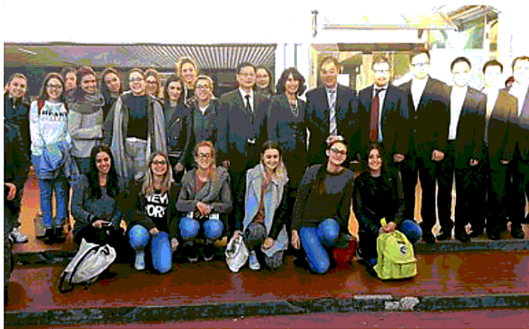
GEMELLAGGIO La delegazione cinese con il dirigente scolastico e alcuni studenti dell'istituto superiore Parentucelli - Arzelà

Il gruppo di delegati ha visitato istituto e laboratori